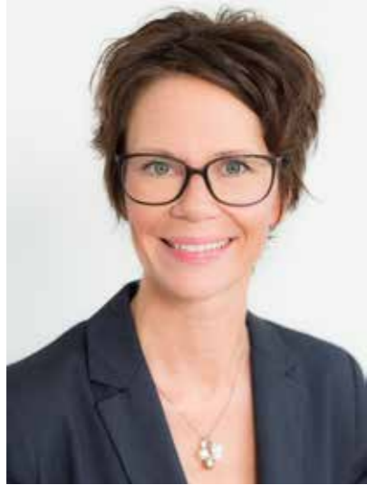
Fortbildungsreferentin WZ® – WundZentren GuKP / ZWM®